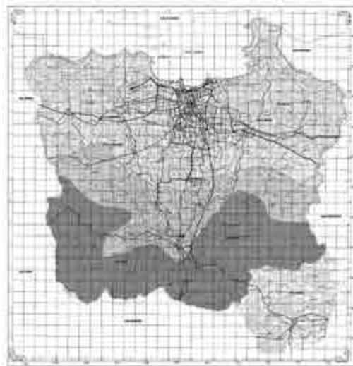
Peta Ruang Lingkup Monitoring Paralegal LBH Jakarta Atas Praktik Diskriminasi dan Intoleransi Berbasis Agama

Sebagaimana telah dijelaskan sebelumnya, bahwa praktek monitoring yang dilakukan di 5 (lima) wilayah yaitu Jakarta, Bogor, Depok, Tangerang, dan Bekasi. Dimana kemudian wilayah Jakarta dibagi ke dalam wilayah Jakarta Utara dan Jakarta Barat. Demikain juga dengan wilayah Bogor dibagi ke dalam Wilayah Cisalada dan Cibinong.