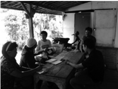
Foto: Wawancara dengan salah satu pihak yang mengetahui peristiwa kekerasan terhadap kelompok Salafy

Aksi penyerangan akhirnya dapat dihentikan, dengan hadirnya aparat kepolisian dan TNI dari wilayah Sektor Kelapa Nunggal dan yang didatangkan dari luar. Keberadaan TNI di lokasi peristiwa sebenarnya sempat tidak diketahui oleh aparat Polsek setempat. Dengan membawa senjata laras panjang, para anggota TNI malah menambah suasana semakin mencekam. Kepala Desa sempat meminta pengertian aparat TNI yang berpatroli untuk tidak menunjukkan senjatanya, sebab hal ini hanya akan menambah kesan mencekam dalam situasi tersebut, dan aparat tersebut akhirnya mau mengerti.