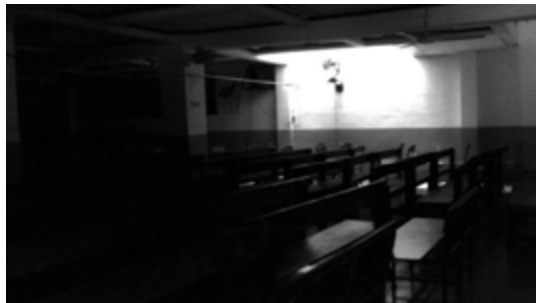
Foto: Suasana Di Dalam Gereja

Dengan adanya kasus tersebut, ada inisiatif dari FKUB untuk mengupayakan duduk bersama dengan Instansi Pemerintah, dalam hal ini KESBANGLINMAS Pemda Bekasi, Kepala kantor KEMENAG Bekasi, dan beberapa Ormas serta tokoh agama Bekasi untuk membahas kerukunan umat beragama, khususnya terkait perijinan tempat peribadatan. Sebenarnya upaya telah dilakukan oleh Pihak FKUB Bekasi sejak 2006 dengan target bahwa pada 2008 izin pendirian rumah ibadah tersebut dapat dikeluarkan, sehingga fungsi ruko yang selama ini digunakan untuk ibadah dapat dikembalikan ke fungsinya semula.