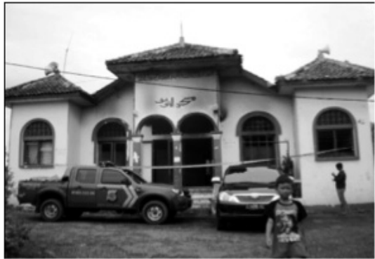
Foto: Masjid At Taufiq, Cisalada, setelah diserang

Setelah sholat magrib dijamak isya lalu warga diminta kembali ke rumah masing-masing sesuai dengan anjuran Polisi. Pukul 19.50 kurang lebih 30 remaja datang ke Cisalada melempar kaca masjid dengan batu sehingga kaca masjid pecah. Mereka juga berusaha membakar masjid dengan melempar api dari obor atau molotov ke dalam masjid.