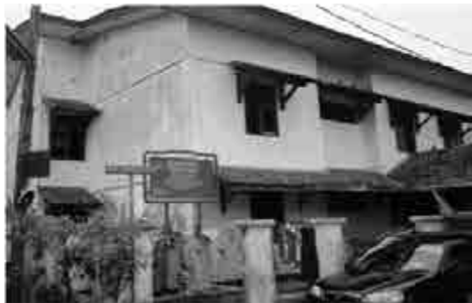
Foto: Asrama Putri STT Setia di Kp.Makassar