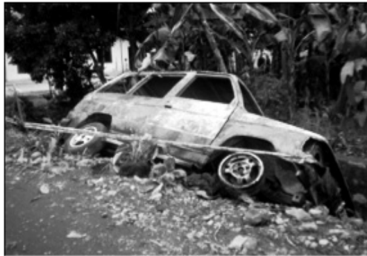
Foto: Kendaraan warga Cisalada yang dibakar

Menurut warga Ahmadiyah Cisalada mereka tidak mempunyai masalah dengan warga kampung penyerang. Beberapa diantaranya sering berolahraga bersama-sama seperti bulutangkis dan tanding bola. Namun sebelum penyerangan ada terhadap beberapa tokoh masyarakat dan agama yang melakukan syiar kebencian. Mereka menyebut dirinya Tim 40 (Pembubaran Ahmadiyah). Beberapa bulan sebelumnya mereka merusak pondasi masjid baru di Cisalada dan juga memasang spanduk besar tepat di pintu masuk kampung Cisalada. Tindakan ini dibiarkan oleh aparat keamanan dan pemerintah. Alasan penyerangan menurut korban karena Ahmadiyah dianggap oleh kelompok penyerang sebagai aliran sesat.