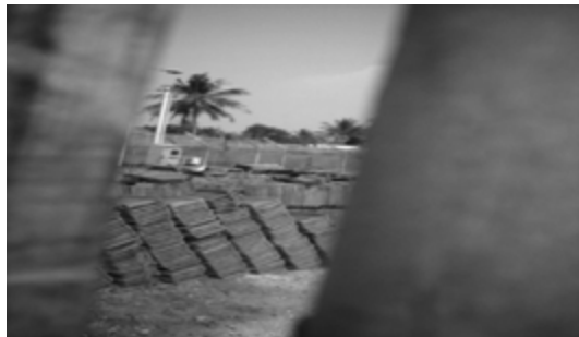
Foto: Situasi Pembangunan Kembali Vihara

Permasalahan diskriminasi dan intoleransi yang terjadi atas penolakan kelenteng Chung Le Miau di Kampung Tegal Angus, Kecamatan Teluk Naga oleh warga setempat telah diselesaikan melalui pertemuan pihak-pihak terkait yang di fasilitasi oleh Forum Kerukunan Antar Umat beragama. Warga sudah tidak lagi menolak dan menerima adanya pembangunan kelenteng. Proses perizinan saat ini hanya tinggal ditandatangani surat rekomendai dari ketua FKUB, lalu ditembuskan ke Kepala Kantor Agama dan pengeluaran IMB oleh Bupati.