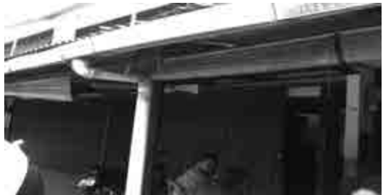
Foto: Situasi Gereja Gereja Katolik Santa Clara Menggunakan Ruko Sebagai Sarana Ibadah

Penggunaan ruko sebagai gereja sudah berlangsung sekitar 10 sampai 24 tahun. Dari 8 gereja yang ada di kawasan ruko perumahan taman wisma asri, hanya ada satu gereja yang mengupayakan pendirian rumah ibadahnya sendiri secara resmi yaitu Gereja Katolik Santa Clara. Pembangunan gereja ini dimaksudkan untuk dapat menampung umat katolik di sekitar wilayah tersebut dan tidak lagi menggunakan ruko sebagai rumah ibadah.