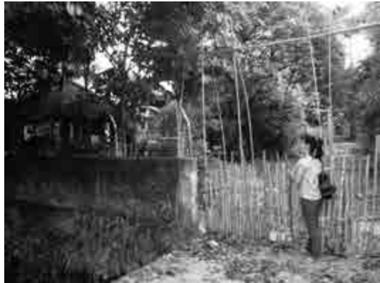
Foto: Lokasi Pembangunan GKI Puri Beta Yang Ditolak Warga