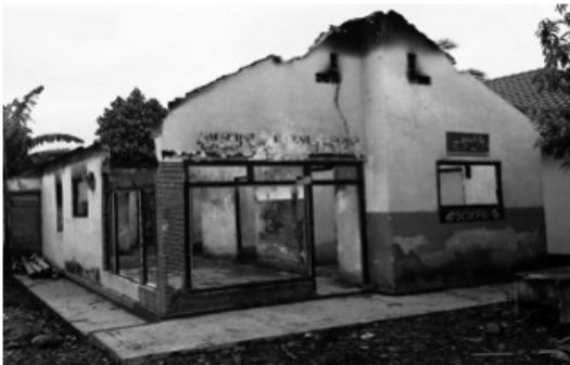
Foto: Rumah warga Cisalada yang dibakar, hingga kini penghuninya tidak mau kembali ke Cisalada dan tinggal di Tangerang karena trauma

Akan tetapi serangan terbesar kepada komunitas Ahmadiyah di Kampung Cisalada, adalah penyerangan yang terjadi pada 1 Oktober 2010. Pada sore harinya, ada informasi warga kampung sebelah bahwa akan ada penyerangan terhadap kampung Cisalada. Awalnya warga Ahmadiyah tidak mempercayai berita tersebut. Ketua RW Humaedi menyuruh anaknya untuk mengecek kebenaran informasi tersebut. Setelah melihat ke kampung Kebon Kopi dan Pasar Selasa anak tersebut melaporkan bahwa memang sudah ada