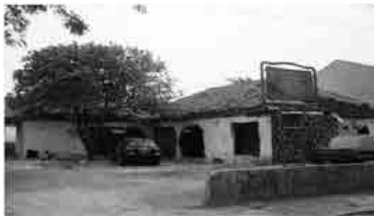
Foto: Asrama Putra STT Setia di Kp.Makassar

Akibat dari penyerangan dan pengrusakan yang dilakukan oleh para pelaku, terdapat korban luka-luka di pihak mahasiswa akibat sabetan samurai. Sedangkan dari pihak pelaku terdapat keterangan bahwa mahasiswa pun menggunakan panah, meskipun tidak ada laporan adanya korban dari pihak penyerang yang terluka akibat panah. Tidak diketahui jumlah pasti korban luka akibat peristiwa tersebut, yang pasti akibat penyerangan tersebut, kampus dan asrama STT SETIA rusak parah sehingga tidak bisa dipergunakan lagi.