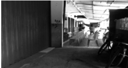
Foto: Situasi Gereja Katolik Santa Clara Menjelang Kebaktian

Rencana pembangunan Gereja Katolik Santa Clara sudah mulai dilakukan sejak 12 tahun yang lalu (sekitar 1998). Gereja katolik Santa Clara rencananya akan dibangun di tanah seluas 6.500 M2 di kawasan perumahan taman Wisma Asri atau sekitar 2 km dari lokasi ruko yang dijadikan gereja sementara. Pihak gereja telah mengajukan izin pembangunan rumah ibadah secara resmi ke instansi terkait, namun sampai saat ini izin mendirikan rumah ibadah yang dinanti-nantikan tidak kunjung diterbitkan.