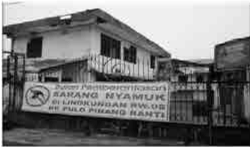
Foto: Kampus STT Setia di Kp. Makassar

menggunakan atribut salah satu ormas FPI. Akan tetapi kelompok massa tersebut semakin bertambah banyak, setelah terdengar ajakan untuk menyerang dari salah seorang pelaku penyerangan melalui pengeras suara salah satu masjid yang letaknya tak jauh dari tempat kejadian.