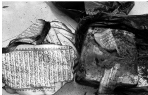
Foto: Alquran termasuk dari barang yang dibakar oleh penyerang

Di dalam keagamaan pun, mereka layaknya warga lain, yaitu shalat, berpuasa, pengajian dan lain-lain. Yang agak membedakan, komunitas Ahmadiyah cenderung melakukan kegiatan keagamaan bersama kalangannya sendiri. Aktifitas keagamaan tersebut kerap dilakukan di sebuah masjid yang terletak di tengah-tengah kampung. Meskipun, pihak Ahmadiyah tidak melarang pihak lain untuk beribadah di masjid mereka, tampak bahwa warga yang bukan Ahmadiyah cenderung melakukan ibadah di masjid lain. Keyakinan komunitas Ahmadiyah yang berbeda dengan keyakinan agama Islam pada umumnya, diduga menjadi penyebab kegiatan keagamaan diantara mereka tidak dapat disatukan.