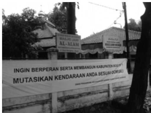
Foto: Lokasi Pondok Pesantren Kelompok Salafy