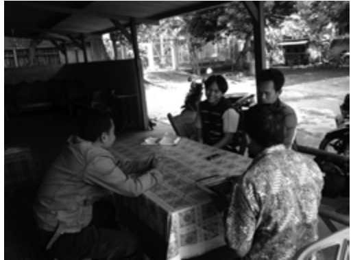
Foto: Wawancara dengan pihak yang mengetahui peristiwa kekerasan terhadap Kelompok Salafy

Banyak warga sekitar yang memasukan putera-puteri mereka ke pondok pesantren kelompok Salafi ini. Kelompok Salafi akhirnya dapat hidup berdampingan dan diterima oleh warga Desa Bojong.